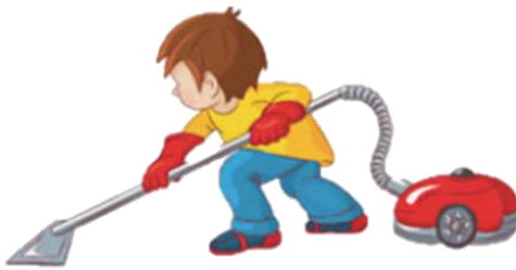
Наводить порядок дома: