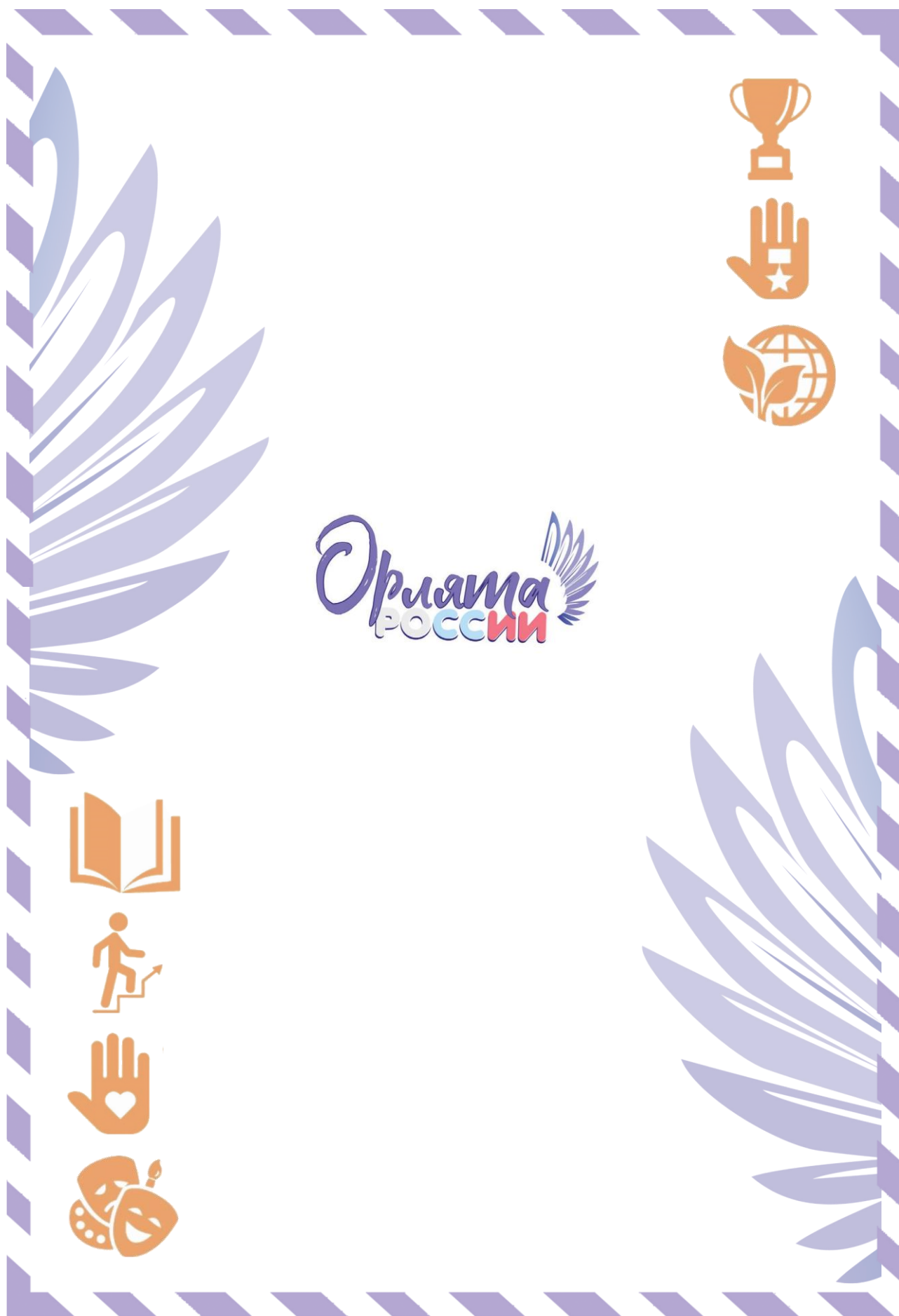
Рис. 2. Обратная сторона «Письма в Будущее»