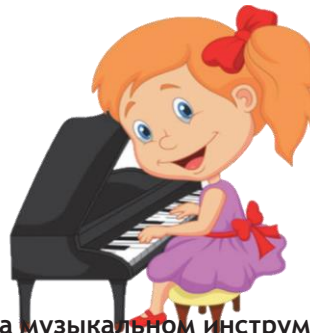
Играть на музыкальном инструменте: