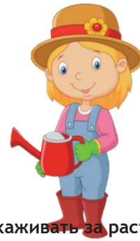
Ухаживать за растениями: