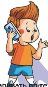
Разговаривать по телефону: