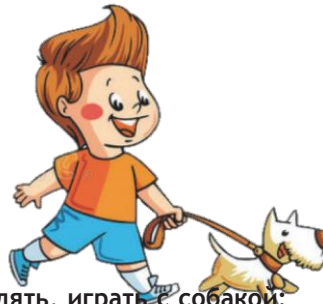
Гулять, играть с собакой: