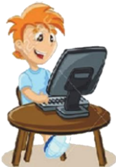
Играть в компьютерные игры: