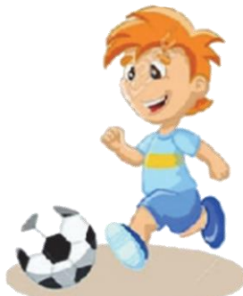
Играть в футбол: